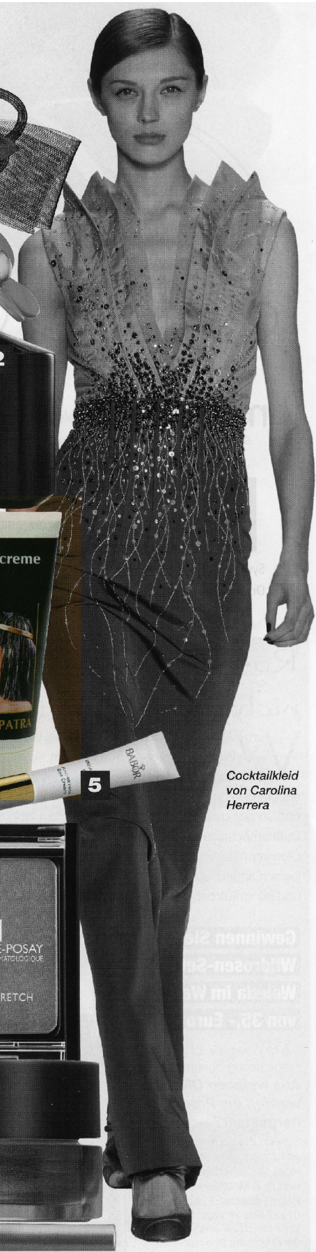
Cocktailkleid von Carolina Herrera